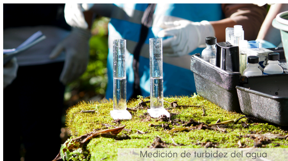
Medición de turbidez del agua