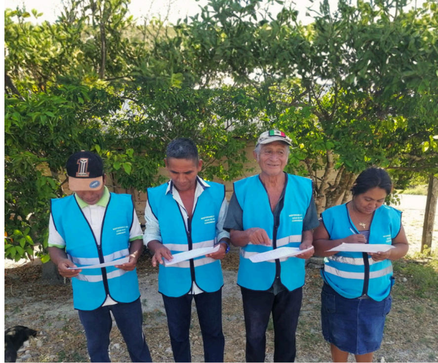
El comité de agua de Ricardo Flores Magón, realizando el censo comunitario 2025