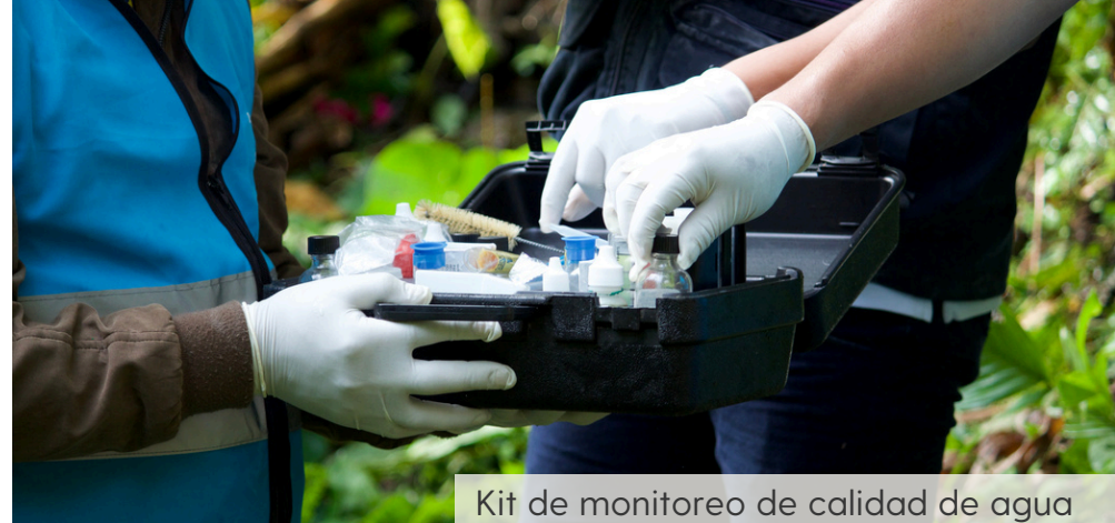
Kit de monitoreo de calidad de agua

Ahora los comités asumen un papel protagónico y autónomo en la defensa del derecho humano al agua.