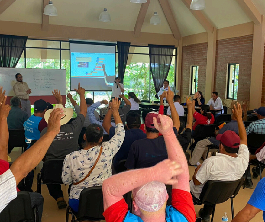
Votación para la elección del comité sectorial estatal de sistemas comunitarios del agua en Calakmul