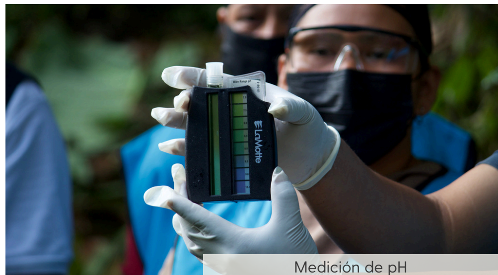
Medición de pH