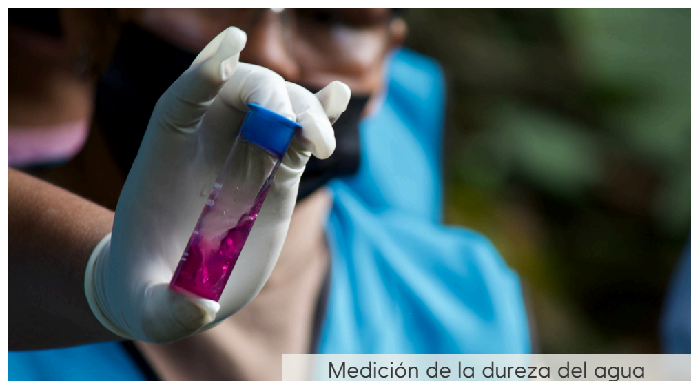
Medición de la dureza del agua