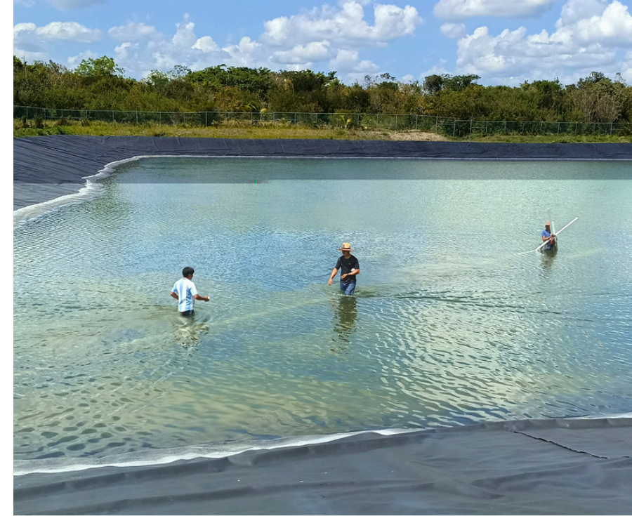
Instalación de bomba sumergible en la olla de agua de La Virgencita de la Candelaria